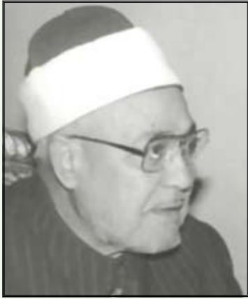
Shejkh Muhamed El-Gazali

N djej se mes bijve të vendit tim ka një "krizë shpirtmadhësie" që nuk njihej kurrë më parë! Nëse hajduti dikur u vidhte diçka kalimtarëve, njerëzit e tjerë e kapnin për fyti, ia jepnin dy-tre shpulla dhe e dorëzonin te policët!